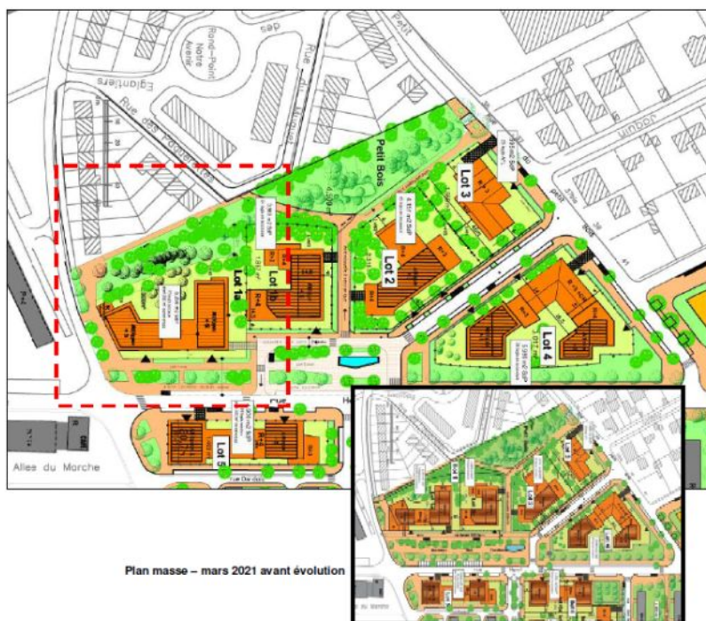
Figure 2: Évolution du projet sur le lot 1.